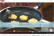
カムザジョン (じゃがいものチヂミ)