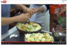
チュクポックム (豚バラ肉と野菜の甘辛炒め)

2回目の今日は、 韓国料理特集 です。 ・チュクポックム(豚バラ肉と野菜の甘辛炒め) ・カムザジョン(じゃがいものチヂミ) ・韓国風わかめスープ 今日の献立はこの3品でばっちり♪