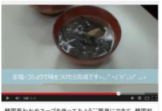
韓国風わかめスープ