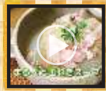
新玉ねぎの丸ごとスープ